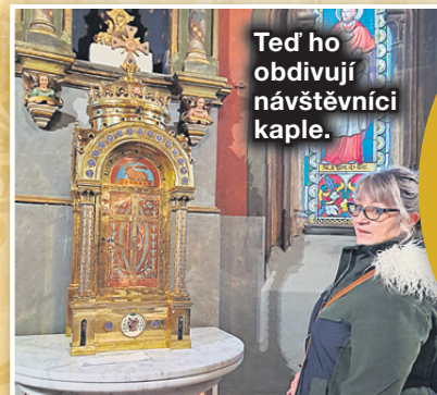
Teď ho obdivují návštěvníci kaple.

...rozsáhlá budova střediska sociálních služeb ve Frýdlantu nad Ostravicí, jejíž součástí je i kaple se svatostánkem, sloužila dříve jako škola, klášter, lazaret i gymnázium?