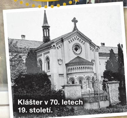
Kláster v 70. letech 19. století.